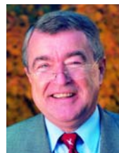
Helmut Heyne Oberbürgermeister der Stadt Cuxhaven

Ich schließe mich dem Dank des Rates herzlich an und darf Sie, liebe Bürgerinnen und Bürger bitten, durch ein gelebtes Bekenntnis zu unserer Stadt und weiterhin tatkräftiges Engagement zu einem attraktiven Cuxhaven beizutragen. Ich bin zuversichtlich, dass durch die immer fortzusetzende Befassung mit der Zukunft der Stadt das Cuxhavener Wir-Gefühl gestärkt wird und aus dem Leitbild viele Ideen und Aktivitäten zum Wohle unserer Stadt erwachsen.