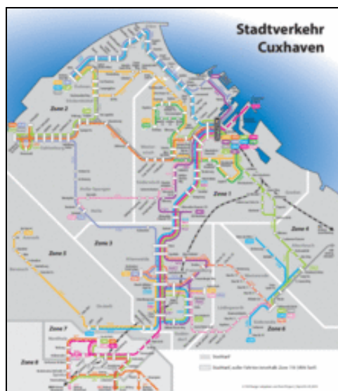
Linien- und Fahrplan

Linienplan und Fahrplan finden Sie hier: