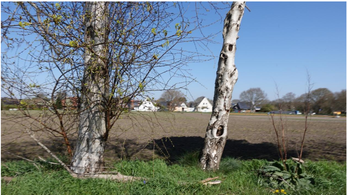
Abb. 4: Blick von der Straße „Schratkamp“ nach Norden auf die Baum-Wallhecke. Die Birke in der rechten Bildhälfte hat mehrere Höhlungen und wurde auf das Vorkommen von Fledermausquartieren untersucht. (Aufnahme: 15.04.2025,).

Ergebnis: Die Begutachtung des Baumbestandes innerhalb des Bebauungsplangebietes Nr. 105 „Westlich der Spanger Straße“ erbrachte weder nach visueller noch nach akustischer Überprüfung mit dem Detektor Hinweise auf Winterquartiere und auch keine Hinweise auf Sommerquartiere von sogenannten „Baumfledermäusen“.