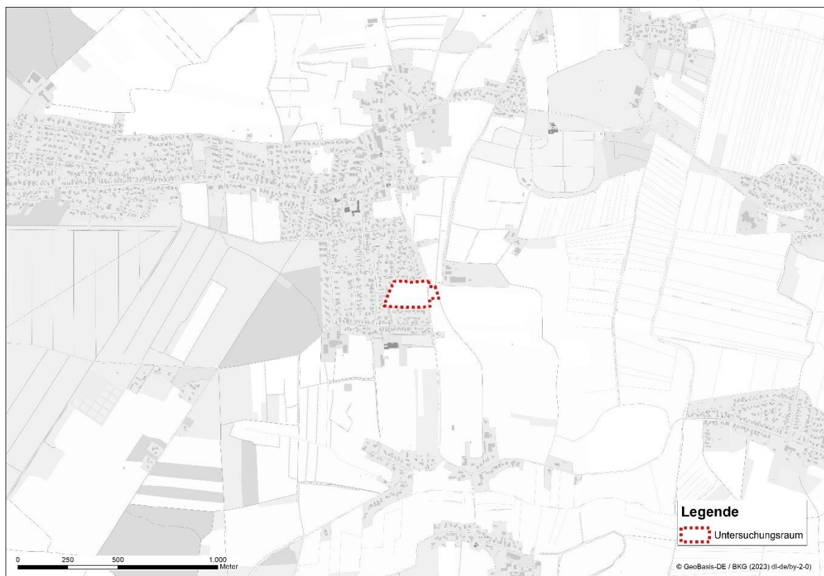
Abb. 1: Untersuchungsgebiet des Planungsvorhabens.

Die Planungen für den östlichen Teil des Untersuchungsgebietes wurden erst im Spätsommer 2025 bekannt. Entsprechend konnten für diesen Bereich keine Kartierungen der Fledermäuse und Brutvögel mehr durchgeführt werden. Alternativ wird für diesen Bereich eine Potenzialanalyse für die Brutvögel und Fledermäuse erstellt.